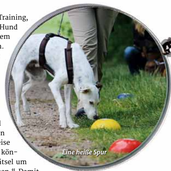
Eine heiße Spur

Mit Lupe und Leckerlis bewaffnet, geht es für die Teilnehmergruppe auf Spurensuche – stets das vorerst